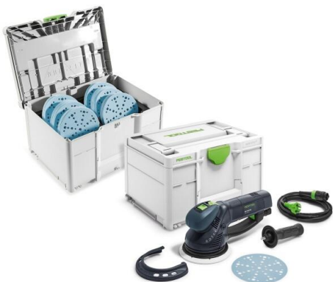
Rotex-RO150 Set mit 120 Schleifscheiben im Systainer