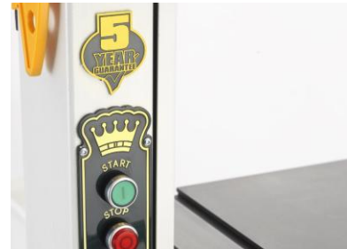
Premium Schaltersystem und 5 Jahres-Garantie