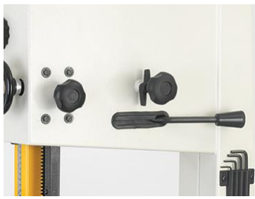
Schnellspann-Hebel für schnellen Blattwechsel