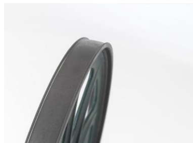
Bombierte Bandsägeräder für ein optimalen Bandlauf