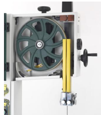
Massive, ausgewuchtete Gusseisen-Räder