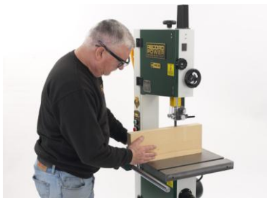
Zwei Bandgeschwindigkeiten für materialgerechtes Sägen