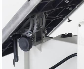
Massive Tischhalterung mit Zahnstange - Gusstisch