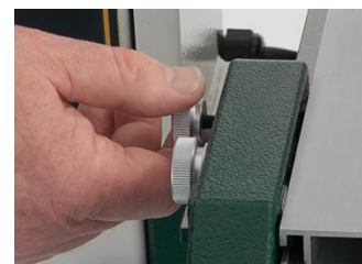
Längsanschlag mit Feinverstellung