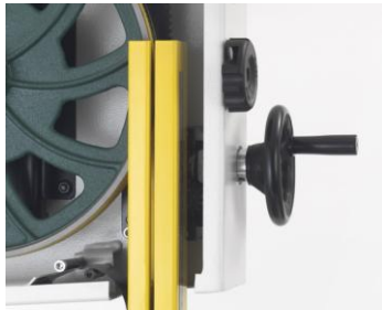
Sägeblattschutz mit Schnitt- höhenanzeige