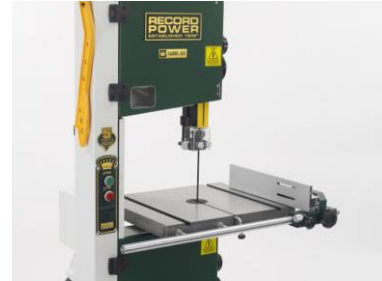
Doppelseite Anschlaghalter, links und rechts